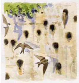
L'hirondelle de rivage ( Riparia riparia )