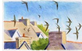
Le Martinet noir ( Apus apus )

Entièrement brunâtre dessus, claire dessous, elle présente un collier sombre sur la poitrine. Pour nicher, elle creuse un terrier dans une paroi sableuse, sur le littoral ou dans une sablière, plus rarement dans des drains de digues ou des talus.