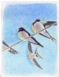
L'hirondelle rustique (= H. de cheminée) ( Hirundo rustica )