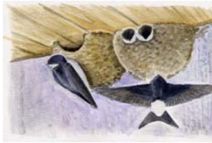
L'hirondelle de fenêtre ( Delichon urbicum )